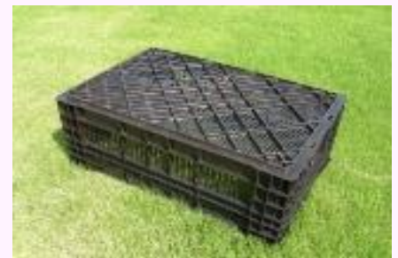
球根トレー: 60cm(L) × 40cm(W) × 24cm(H)